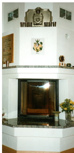
Familienwappen auf Keramikplatten