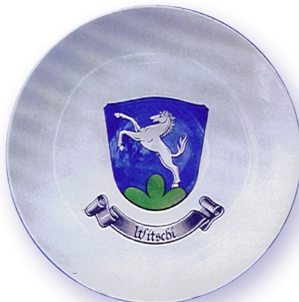
32cm Ø Wandteller

Dies ist nur eine kleine Auswahl unserer Arbeit in der Malerei von Familienwappen auf Keramik. Gerne senden wir Ihnen noch weitere Unterlagen oder beraten Sie bei uns im Atelier.