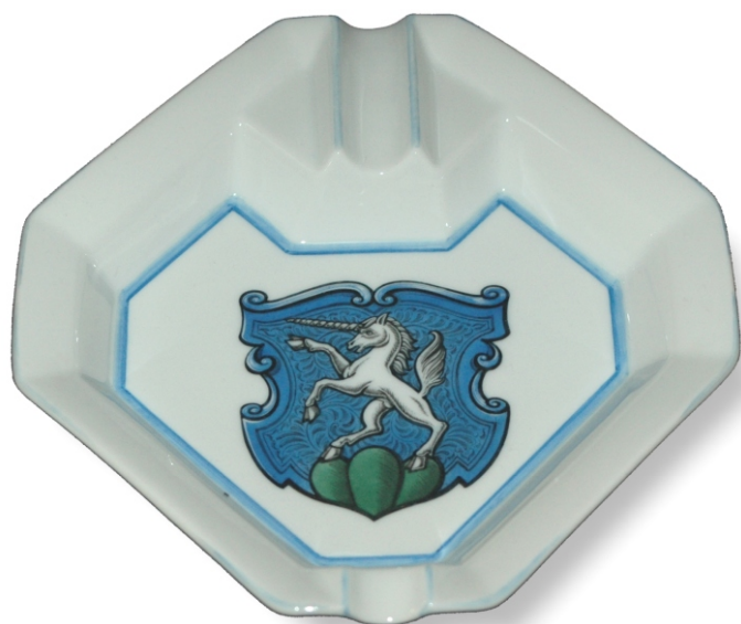
Familienwappen in Zigarrenaschenbecher