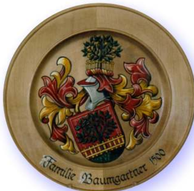
ca. 29cm Ø Nr. 508