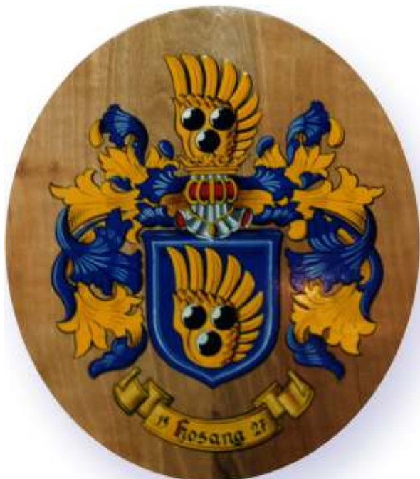
ca. 40cm x 30cm Nr. 534